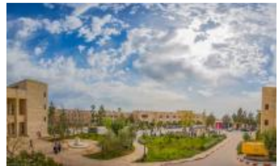
جامعة بيرزيت تبدأ احتفالاتها بتخريج الفوج الـ 48 من طلبتها

نحن نستخدم ملفات تعريف الارتباط لتحسين تجربتك ، وتحليل أداء موقعنا ، وتقديم المحتوى ذي الصلة (بما في ذلك الإعلانات). من خلال الاستمرار في استخدام موقعنا ، فإنك توافق على استخدامنا لملفات تعريف الارتباط وفقاً لموقعنا سياسة ملفات الارتباط