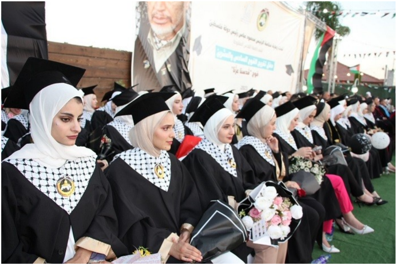
علامات #جنين #حفلات #جامعة القدس المفتوحة #تخرج