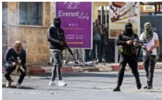
سرايا القدس "كتيبة جنين" تُصدر بياناً عسكرياً حول تفاصيل ما جرى في مدينة ومخيم جنين