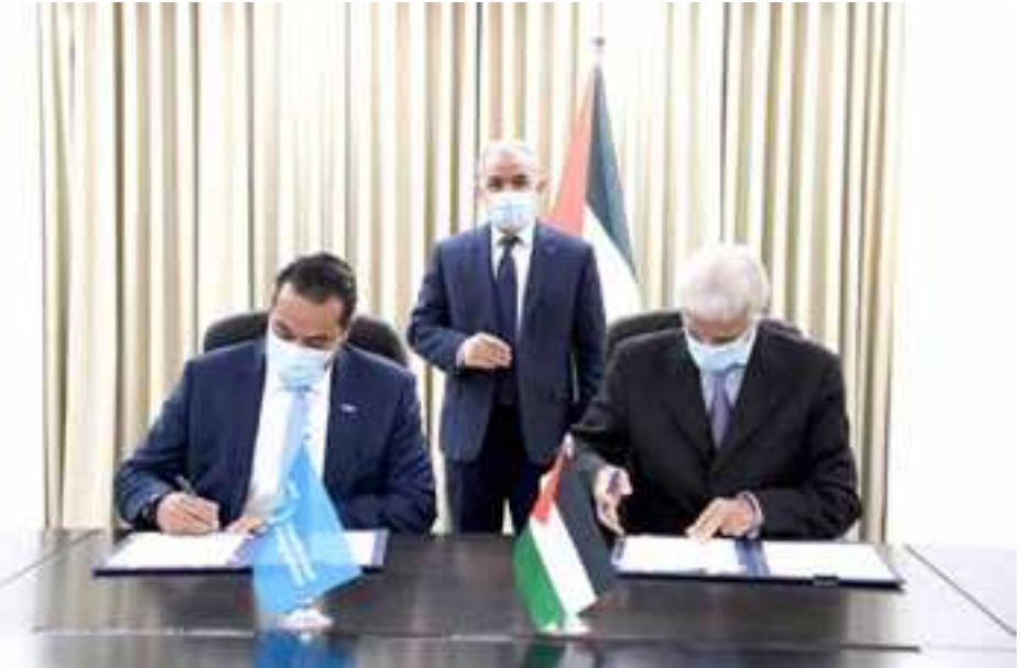
جانب من توقيع مذكرتي التعاون بحضور اشتية.