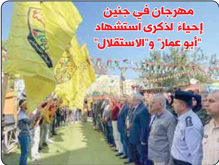
مشاركون في المهرجان.

جنين - وفا: أحييت حركة "فتح" - إقليم جنين، وحركة الشبيبة الطلابية، ومجلس اتحاد الطلبة في جامعة القدس المفتوحة، أمس، الذكرى الـ ١٨ لاستشهاد الرئيس ياسر عرفات "أبو عمار"، وذكرى إعلان وثيقة الاستقلال. وقال نائب رئيس حركة "فتح" محمود العالول في كلمته: "لن يكون سلام دون حصول شعبنا على حقوقه، وإقامة دولته المستقلة وعاصمتها القدس، وتبويض السجون من كافة الأسرى والأسيرات".